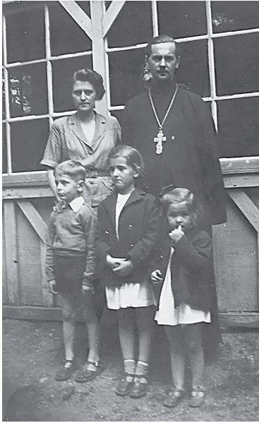
Ziua plecării în America