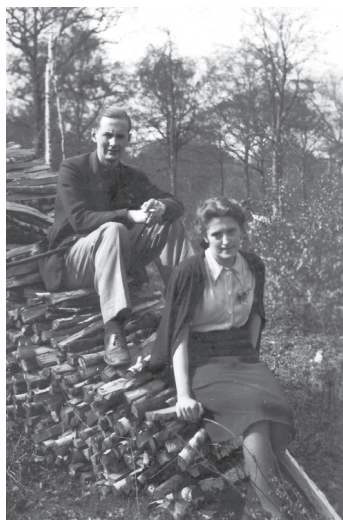
Un picnic în Franța, 1943

Greu de crezut, dar într-o bună zi, viitoarea mea soacră, după ce a luat metrourul și autobuzul, a ajuns pe neașteptate acasă la părinții mei în Clamart! Nici Alexander, nici eu n-am știut nimic. Ea le-a cerut, oficial, mâna mea părinților mei, într-un mod memorabil, de modă