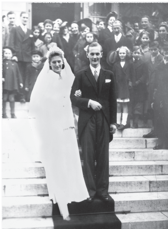
Căsătoria noastră, 31 ianuarie 1943